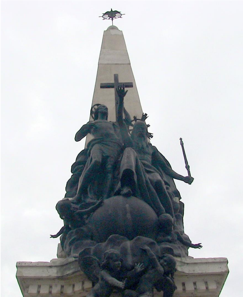
Denkmal der Heiligen Dreifaltigkeit