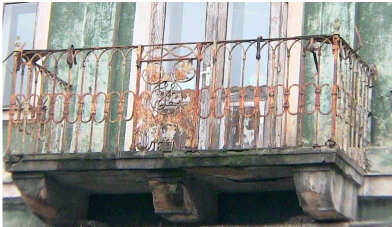
Hirschl Monogramm am Balkon 1817