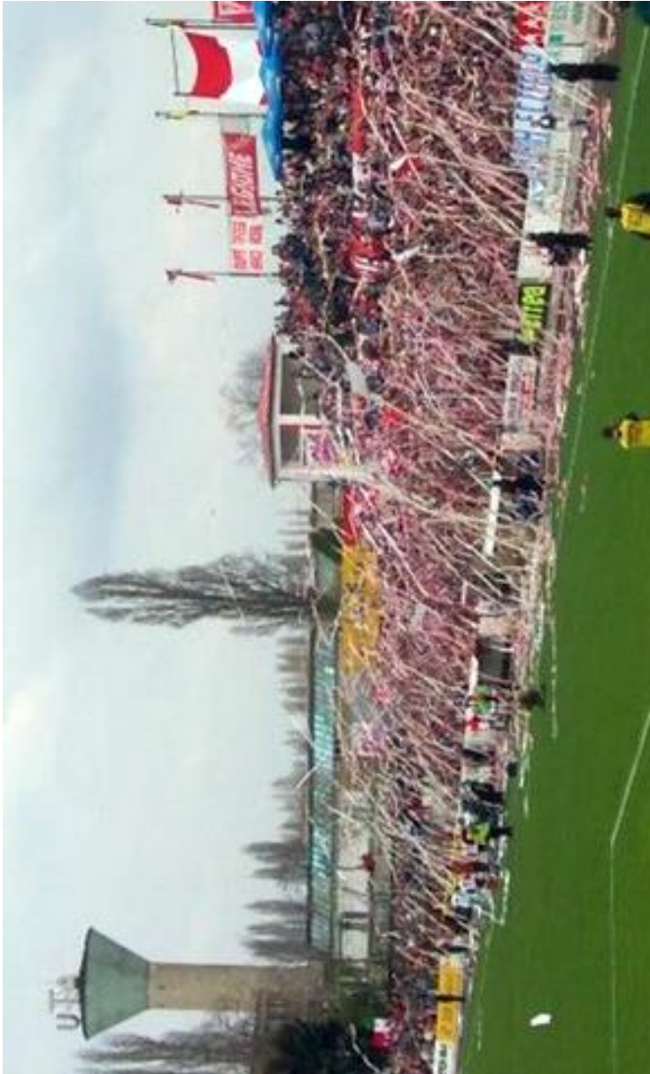
UTA Fußballverein des Barons Neumann