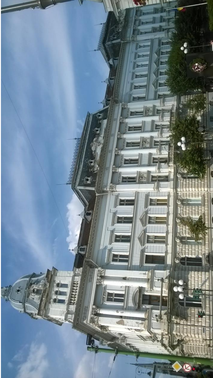
Finanzamt und Rektorat Uni, Sanitärlyzeum