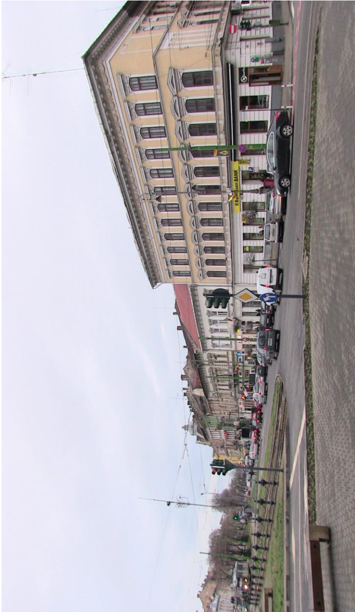
Boulevard – vormalis Corso