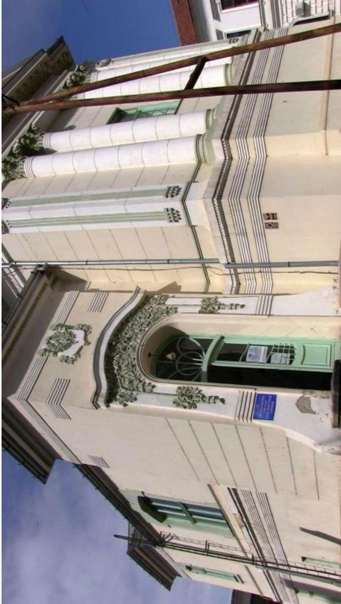
Freimaurer Tempel Concordia