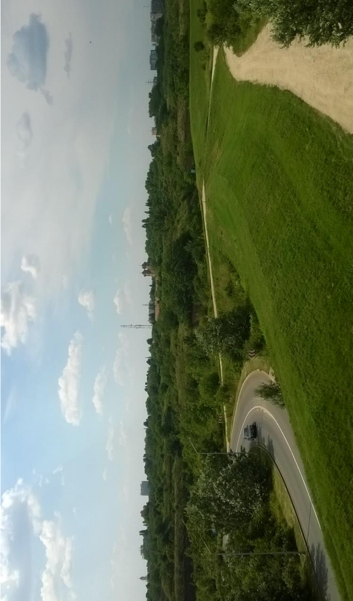
Vauban Festung von Arad