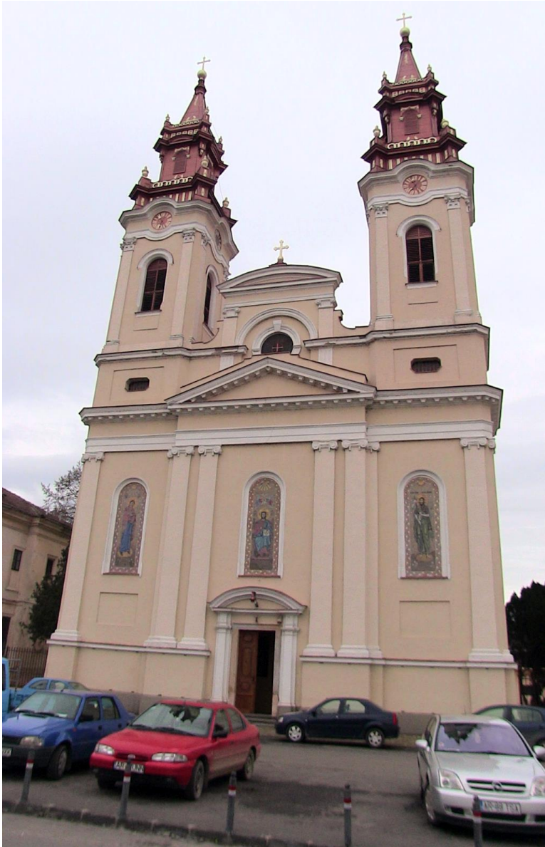
Alte Orthodoxe Kathedrale am Markt