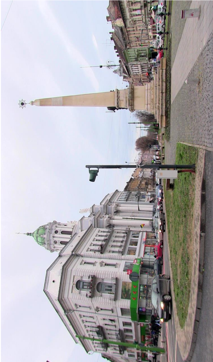
Minoritenkirche – Katholische Kathedrale