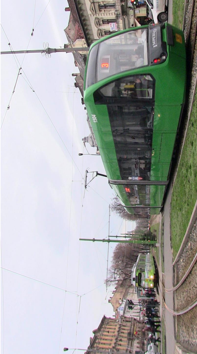
Hauptstraße "Boulevard der Revolution"