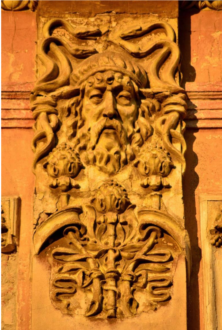
Basorelief im Jugendstil