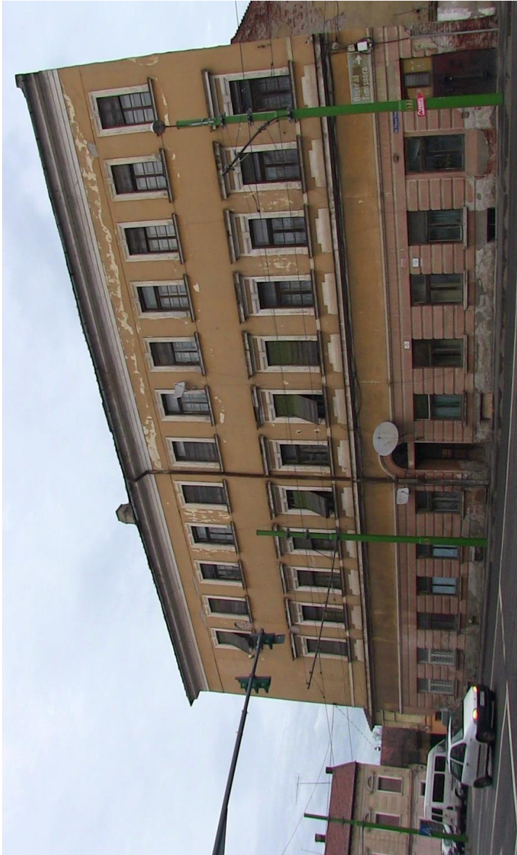
Haus der Zünfte