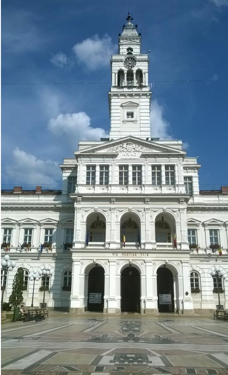
Mosaik vor Rathaus