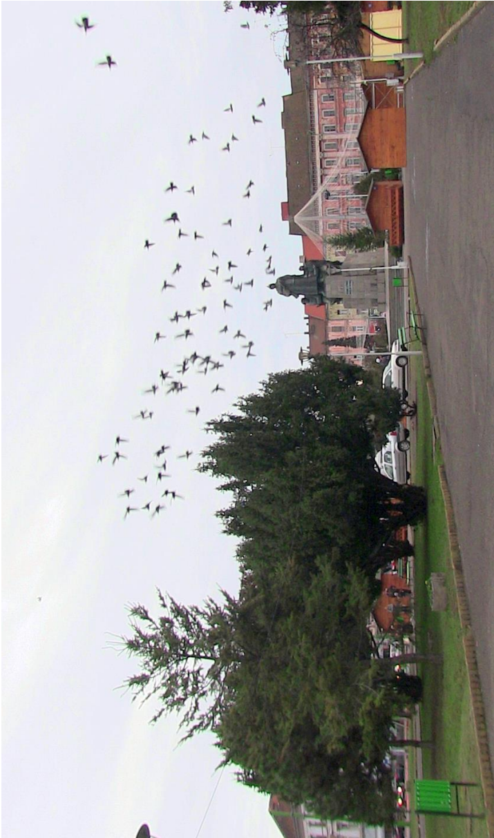
Kriegerdenkmal am Freiheitsplatz