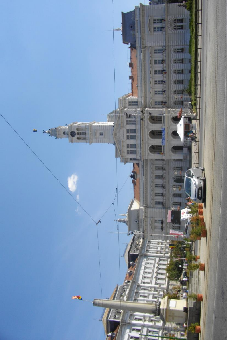
Rathaus und Denkmal der Revolution