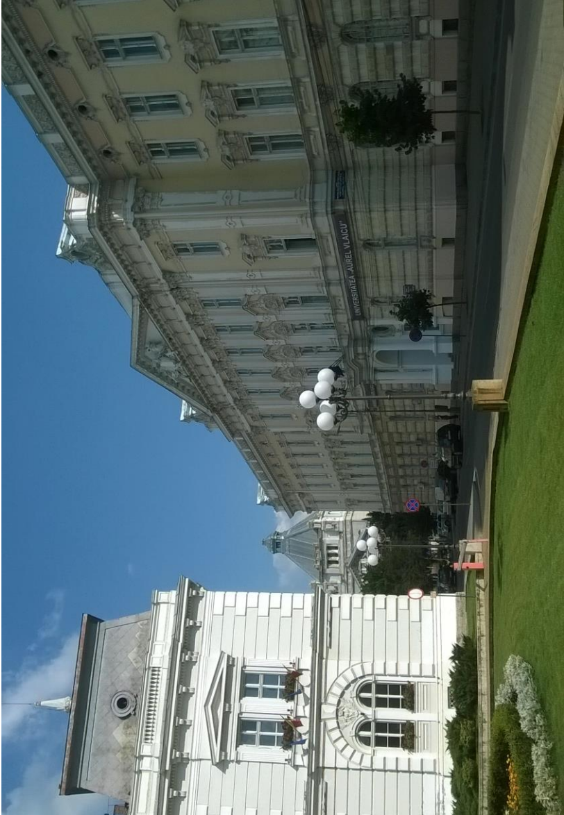
Sanitärlyzeum, heute Uni Aurel Vlaicu