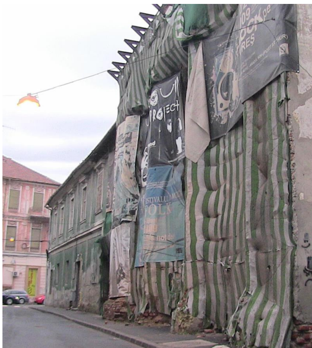
Ruine Altes Theater