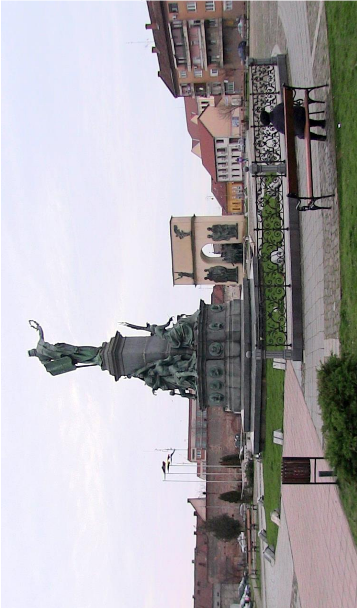
Platz der rumänisch-ungarischen Versöhnung