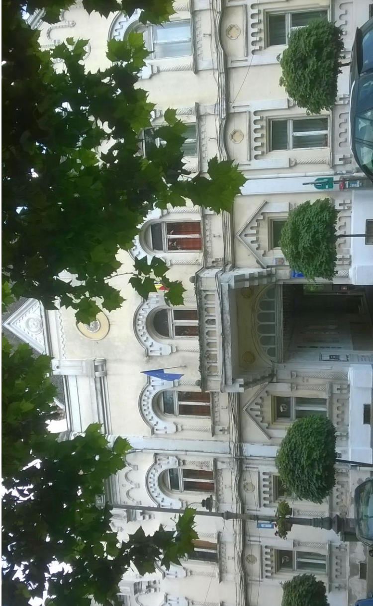
Andrényi Palast (Kinderpalast)