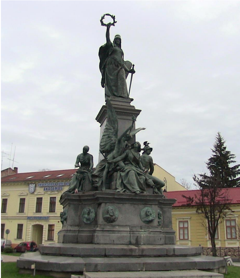
Freiheits-Statue Gewidmet der Bürgerrevolution 1848 Denkmal der 13 Märtyrer Generäle Wahrzeichen von Arad