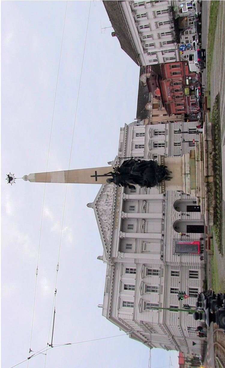
Theater und Dreifaltigkeits-Säule