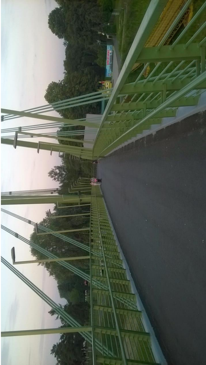
Brücke zum Neptun Strand